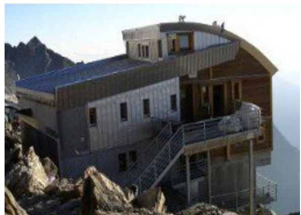
Refuge de Tête Rousse 3160m