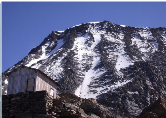
Refuge du Goûter 3850m