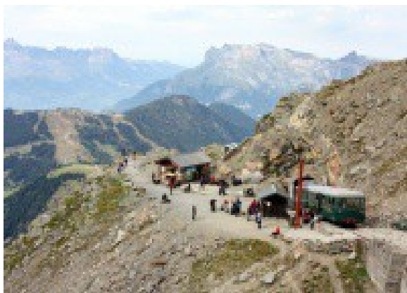
Gare d'arrivée Nid d'Aigle

Après, une pause déjeuner, nous allons apprendre les techniques de progression d'encordements, de cramponnages et d'utilisation du piolet sur le glacier de Tête Rousse; pour pouvoir évoluer dès le lendemain en toute sécurité avec votre Guide de Haute montagne sur l'itinéraire du Mont-Blanc.