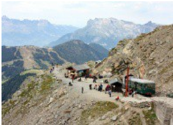
Gare d'arrivée Nid d'Aigle

Montée et nuit au refuge du Goûter (3850 m) depuis la gare d'arrivée du Nid d'Aigle (2372 m)