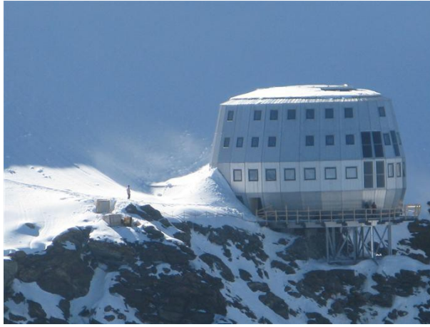
Refuge du Goûter 3850m