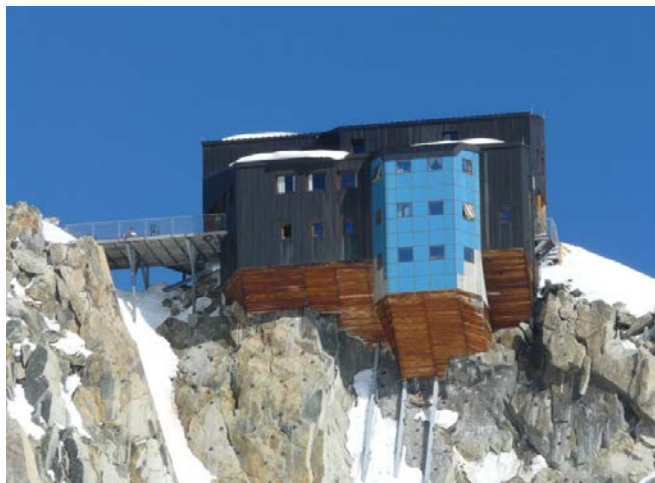
Refuge des Cosmiques 3613m.

Jour 1 : Montée en fin d'après-midi au refuge des Cosmiques par l'intermédiaire du téléphérique de L'Aiguille du Midi (1h de marche depuis l'Aiguille du Midi à 3842m.)