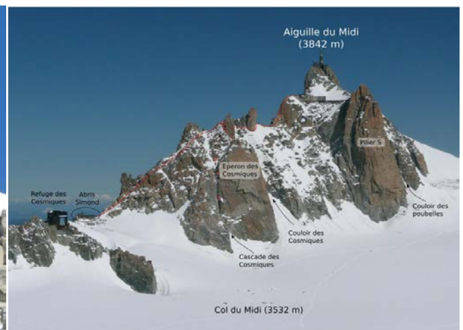
Accès au refuge (à droite par le glacier)

Jour 2 : Départ depuis le refuge des Cosmiques à 3h00 du matin pour gravir successivement, l'épaule du Mont-Blanc du Tacul 4100m, puis le Mont Maudit 4345m, et enfin terminer jusqu'au sommet du Mont-Blanc 4808m, en passant par le col de la Brenva et le mur de la côte.